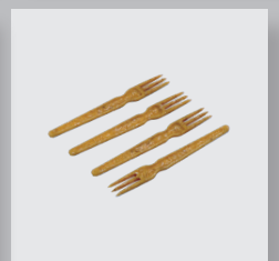
Bestecke aus Polypropylen (wiederverwendbar)