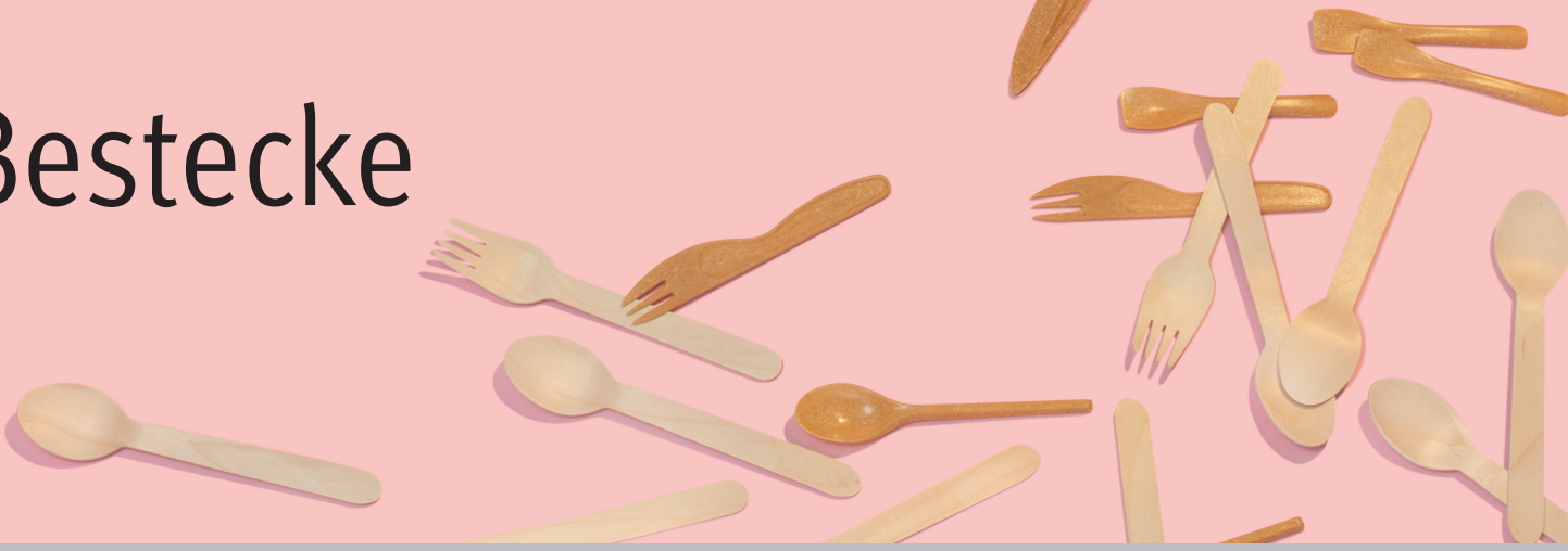
Bestecke & Rührstäbchen aus Holz